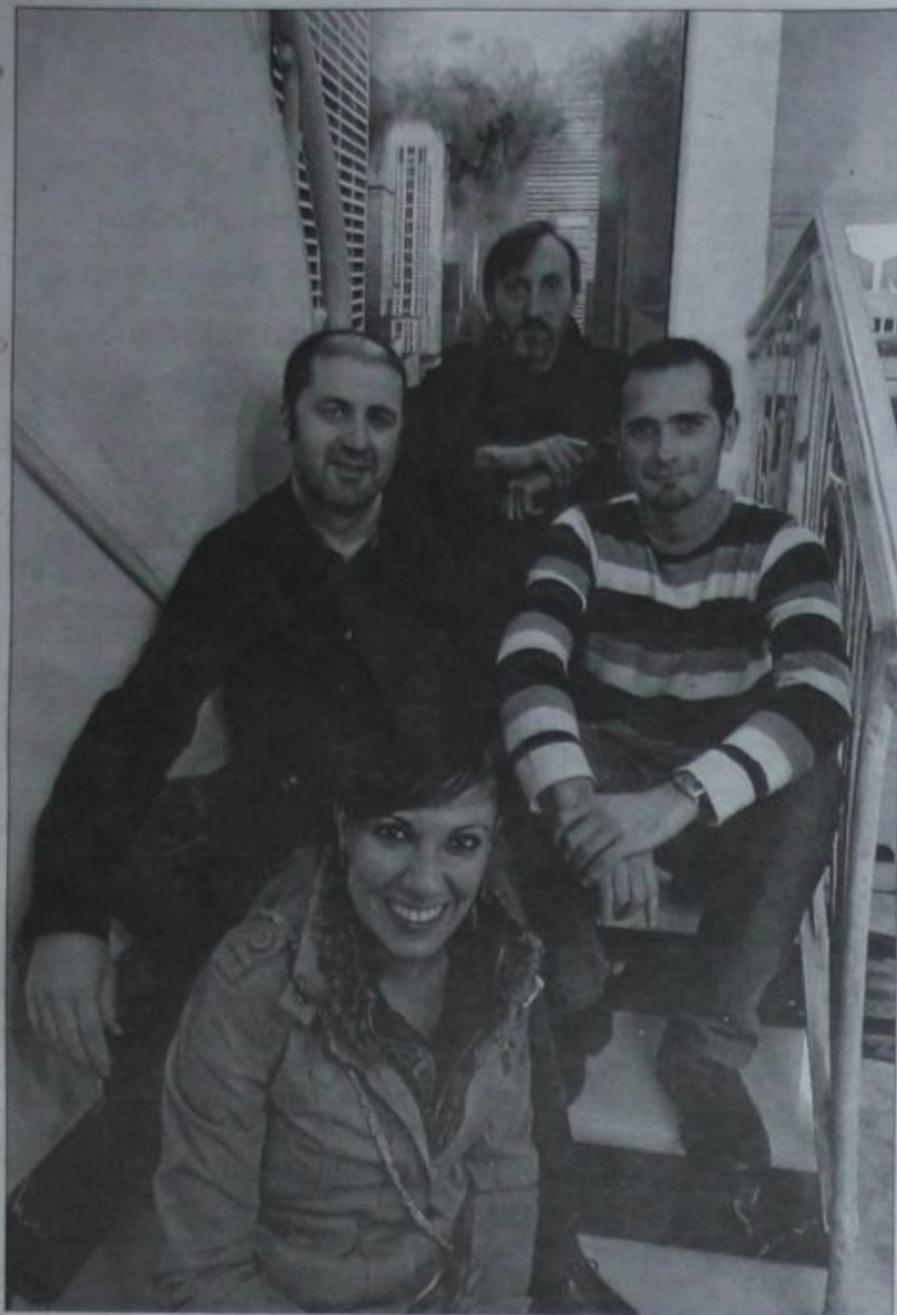
Los cuatro artistas, en la galería ciezana.